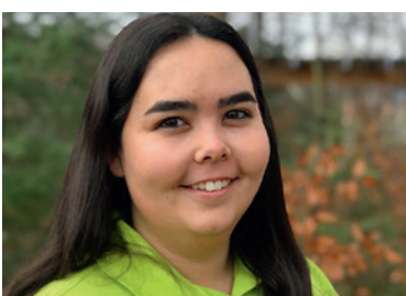
MELANIE ANON WIL