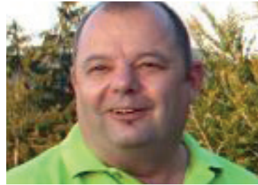
RES NÄF FURT/BRUNNADERN