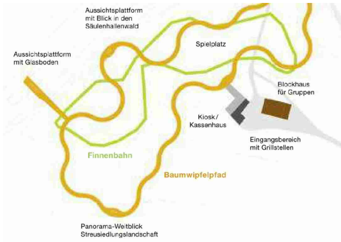
Aussichtsbucht mit Bank, Ausblick in Landschaftskammer